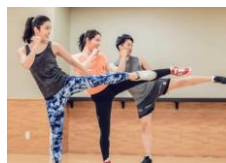
ファイトアタックBEAT