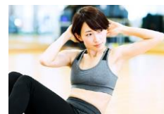
ファンクショナルトレーニング